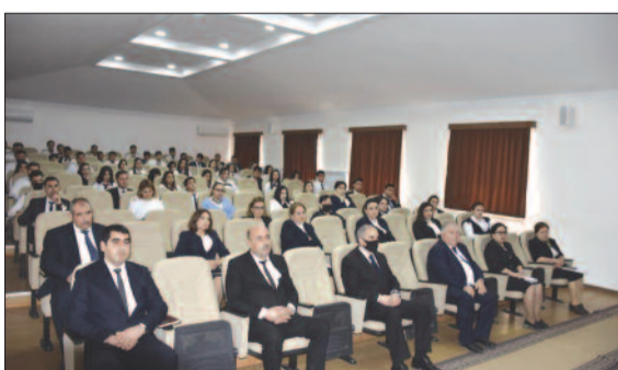
Naxçıvan Müəllimlər İnstitutunda tədris planlarına uyğun olaraq Təsviri incəsənət müəllimliyi, Təhsildə sosial-psixoloji xidmət ixtisaslarının pedaqoji, Kitabxanaçılıq və informasiya fəaliyyəti ixtisasının isə ixtisas təcrübələrinin başlanğıc konfransı keçirilib.

Naxçıvan Müəllimlər İnstitutunun mətbuat xidməti